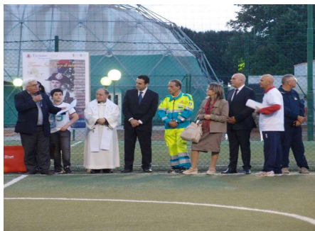
Campo di calcetto Parco Ricchello durante l'inaugurazione di un Torneo di calcetto

per i più piccoli -, ha pensato bene di assumere la gestione in proprio. Quindi, con un atto di coraggio, l'attuale governo cittadino ha voluto prendere in mano la situazione per ridare al nostro Parco, invidiato da tanti paesi limitrofi, la sua vigoria iniziale, l'estetica che gli è propria e cioè la cura del tanto verde presente al suo interno. Finalmente si sono riviste le famiglie, i giovani, gli anziani, gli sportivi, che fanno rivivere all'interno del Parco Ricchello una parte fondamentale del nostro tessuto sociale.