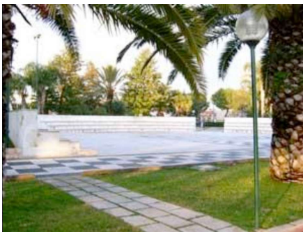
Veduta interna del Parco Ricchello

Da sempre, dal giorno della sua inaugurazione nella metà degli anni '90, il Parco Ricchello ha rappresentato per la nostra città il grande polmone verde, dove è stato possibile promuovere processi di socializzazione. L'attuale Amministrazione Comunale, dopo anni di gestione esterna della struttura - che ricordiamo al suo interno prevede una pista di atletica, un pallone tensostatico, un teatro all'aperto adibito anche a pista di pattinaggio, due campi di calcetto e tanti giochi