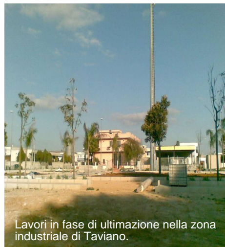
Lavori in fase di ultimazione nella zona industriale di Taviano.

Il progetto si sta realizzando con un finanziamento di € 1.300.000,00 , progetto definitivo di cui 284.950,59 € a carico dell'amministrazione comunale e 1.015.049,41 € co-finanziati con fondi PO FESR 2007-2013. Infatti sono in fase di completamento i lavori della rete idrica e della fogna nera nella zona industriale di Taviano, che permetterà in questo modo alle vecchie aziende ed ai nuovi insediamenti produttivi di beneficiare di tutti i servizi primari.