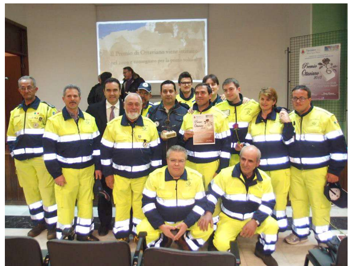
Il Gruppo della Protezione Civile di Taviano