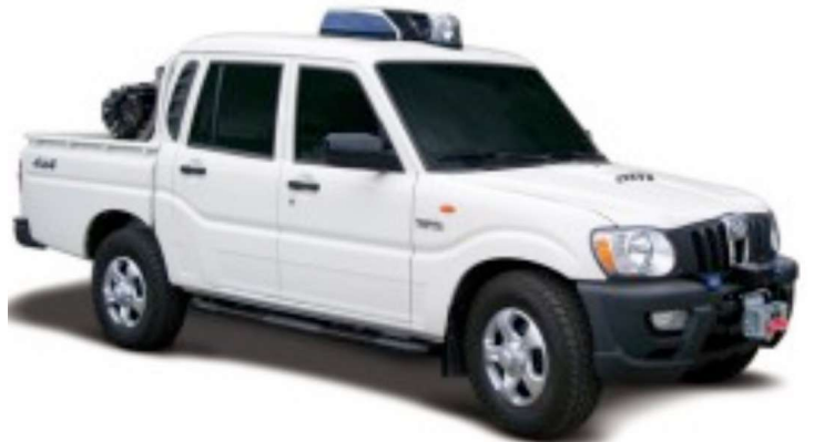
Modello Pick-Up doppia cabina - cassone con modulo antincendio in dotazione alla Protezione Civile di Taviano dall'Amministrazione Comunale.

L'amministrazione Comunale, per ovviare a tutto questo, ha dotato la Protezione Civile di Taviano, gruppo di volontari encomiabile già per il suo lavoro di supporto alle forze dell'ordine, di un importantissimo strumento per gli interventi di emergenza provocati dal maltempo, una Pick - Up 4x4 con doppia cabina e cassone con modulo antincendio, nuovo di zecca. L'auto che sarà data in dotazione quanto prima alla Protezione Civile sarà arredata di quanto necessita per renderla operativa, nell'eccellenza, nei suoi interventi e il costo è stato finanziato in larga parte da fondi sovracomunali.