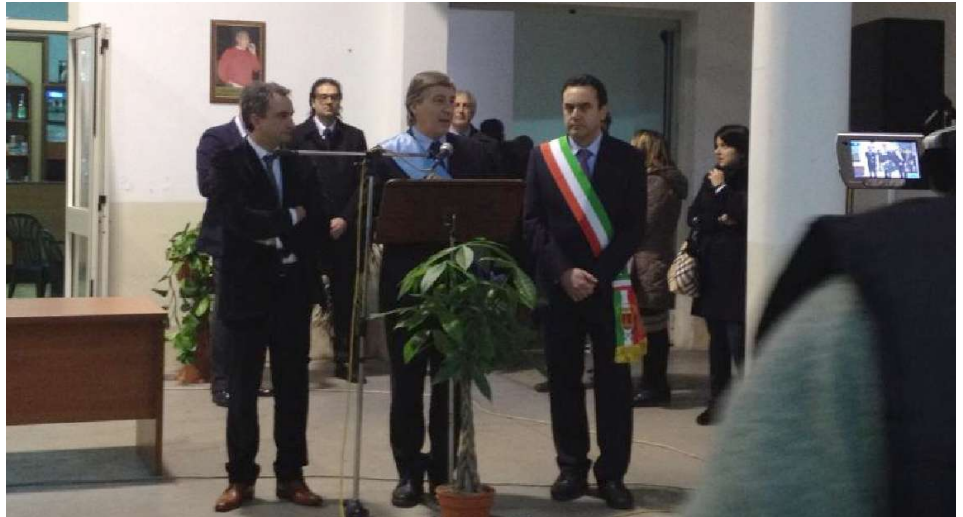
L'inaugurazione della gestione diretta del Mercato dei Fiori l'8 marzo 2013

In meno di due anni abbiamo espletato in assoluta trasparenza tutti gli iter necessari previsti (le delibere di giunta, di consiglio comunale, e tutti gli atti gestionali) per ridare alla Città di Taviano uno dei suoi gioielli, strumento fondamentale per tutto il tessuto produttivo, che rischiava di finire, in mano a privati. Con la gestione diretta del Mercato dei Fiori abbiamo ottenuto un risultato di portata storica, oggi consideriamo questo evento la sua seconda inaugurazione dopo quella di metà degli anni '90. Per più di 15 anni il mercato è stato gestito da Mercaflor, una società mista creata ad hoc, dagli amministratori di allora, che ha comportato spese esose