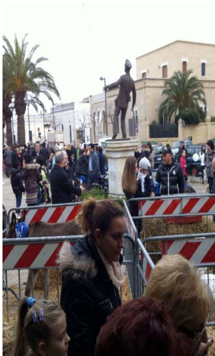
Organizzazione della manifestazione Telethon 2012