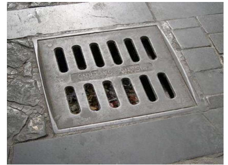
Caditoie dopo la pulizia