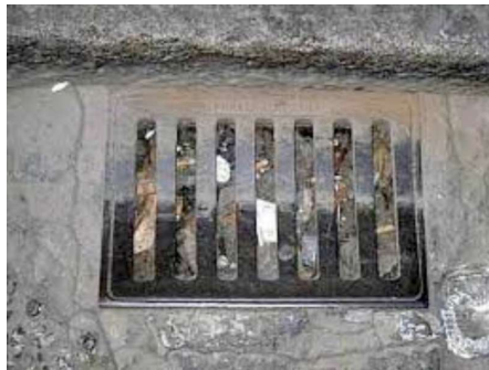
Caditoie prima della pulizia

Operazione di pulizia delle caditoie stradali, da tempo abbandonate a evidenti situazioni di degrado: i lavori di pulizia hanno avuto inizio il 6 novembre del 2012 e hanno avuto termine il 22 gennaio 2013 con il risanamento di circa 700 caditoie e pozzetti. Questo intervento ha avuto lo scopo di ripristinare la perfetta efficienza idraulica, consentendo alle caditoie di operare al massimo delle proprie capacità per il bene comune della nostra città.